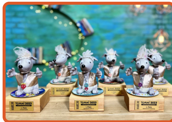
So sehen Siegerhunde aus

Okay, bin dabei. Was muss ich tun? Fülle den Anmeldebogen auf https://tommi.kids/kindersoftwarepreis/teilnehmen/kinderjury aus, lass deine Eltern unterschreiben und mit etwas Glück bist du mit in der TOMMI-Kinderjury. Gespielt, geprüft und bewertet wird in deiner Bibliothek. Nähere Infos erhältst du dort.